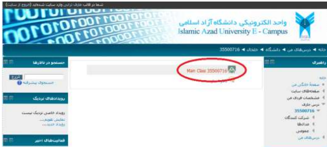
( شکل ۶ )

پس از کلیک بر روی درس مورد نظر ( شکل ۶ ) ظاهر میگردد . بر روی Main Class کلیک کنید.