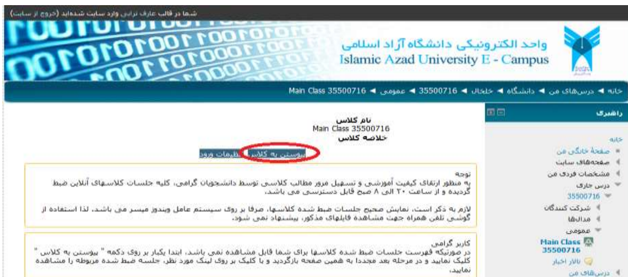
( شکل ۷ )

در صفحه جدید ( شکل ۷ ) جهت ورود به کلاس درس، بر روی دکمه پیوستن به کلاس کلیک کنید. در این زمان به برنامه Adobe connect هدایت میشوید.